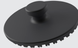
MM-Welding® ワンコンポーネントクリップソリューション