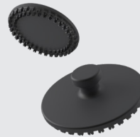
LiteWWeight® ロータスアバローネ ML