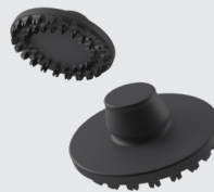
LiteWWeight® ロータスアバローネ MS