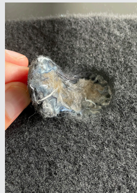
引き抜き試験は、 基板素材への集約を示しています。