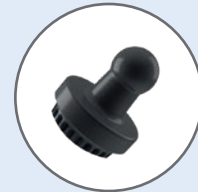
ボール / クリップ