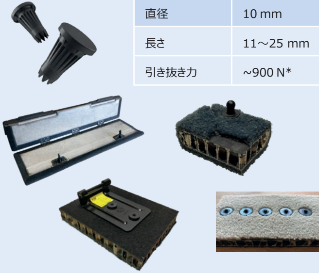
スタンダードピン

事前に穴あけまたは成形した穴の設置が不要で、グラスファイバーの表層に取り付けることができます。